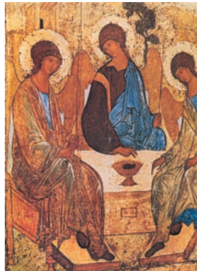
Αγία Τριάδα, έργο του Αντρέα Ρουμπλιόφ. Πανακοθήκη Τρετιάκοφ, Μόσχα.