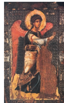
Αρχάγγελος Γαβριήλ. 12ος αι. Περίβλεπτος, Οχρίδα, πρώην Γιουγκοσλαβία.

Οι ιεραποστολικές βάσεις, που έθεσαν τον 9ο αιώνα οι Κύριλλος και Μεθόδιος, βοήθησαν την Εκκλησία να μεταδώσει τις αλήθειές της και στους Ρώσους τον 10ο αιώνα. Όταν βαπτίστηκαν οι Ρώσοι του Κιέβου και ο ηγεμόνας τους ο Βλαδίμηρος, άρχισε η πολιτιστική ανάπτυξη της Ρωσίας, με τις μεταφράσεις εκκλησιαστικών συγγραμμάτων και της Θείας Λειτουργίας, καθώς και με την ανάπτυξη της ναοδομίας.