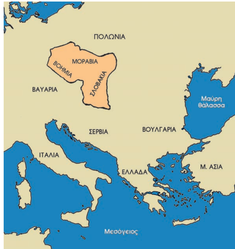
Οι περιοχές που εκχριστιάνισαν οι Κύριλλος και Μεθόδιος.

διος βασανίστηκε και φυλακίστηκε (ο Κύριλλος είχε ήδη πεθάνει στη Ρώμη το 869 μ.Χ.). Έτσι εγκαταλείφθηκαν οι περιοχές, για τον εκχριστιανισμό των οποίων είχαν αγωνιστεί με όλες τους τις δυνάμεις τα δύο αδέρφια. Πάντως οι δύο ιεραπόστολοι έδωσαν στους σλαβικούς λαούς την ευκαιρία να αντιληφθούν ότι το μήνυμα του Χριστιανισμού ήταν ανεξάρτητο από εθνότητες, απευθυνόταν σε κάθε άνθρωπο, με πλήρη σεβασμό της πολιτιστικής του ιδιαιτερότητας.