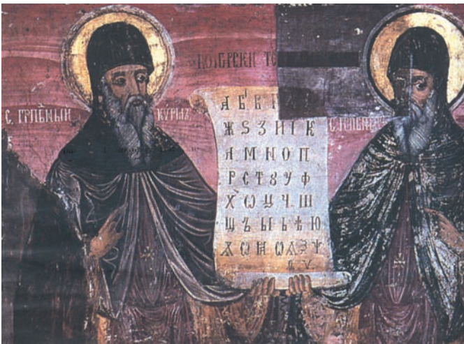
Οι άγιοι Κύριλλος και Μεθόδιος, τοιχογραφία 12ου-13ου αι., νάος Μεταμόρφωσης του Σωτήρος, Μπελιάκβο Βουλγαρίας.

Η πολιτική κατάσταση, όμως, άλλαξε σύντομα και, με την επέμβαση των Φράγκων, ο Μεθό-