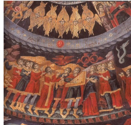
Ανείτε τον Κύριον. Τοιχογραφία από τον Αγ. Νικόλαο στο Τσεπέλοβο της Ηπείρου, 18ος αι.

Σε εποχές κατά τις οποίες αιρετικοί χρησιμοποίησαν ύμνους για να διαδώσουν τις διδασκαλίες τους, παρουσιάζεται αύξηση της παραγωγής ύμνων και από μέρους της Εκκλησίας, στην προσπάθειά της να αντισταθεί με τα ίδια μέσα στη διάδοση των αιρετικών αντιλήψεων.