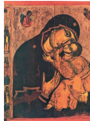
Παρθένος η Ελεούσα. Εθνικό Αρχαιολογικό Μουσείο Σόφιας, Βουλγαρία.