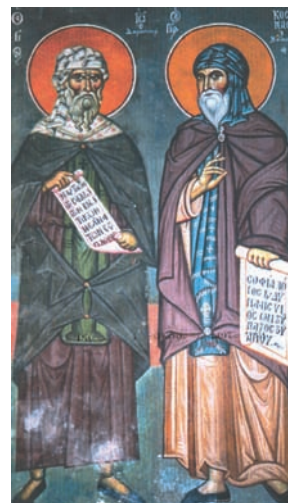
Ιωάννης Δαμασκηνός και Κοσμάς ο Μελωδός. Νωπογραφία Φώτη Κόντογλου, Καπνικαρέα.

Οι ύμνοι λέγονται και τροπάρια , επειδή ο καθένας έχει δικό του τρόπο για να ψαλεί, και η γενική αυτή ονομασία έχει επικρατήσει μέχρι σήμερα.