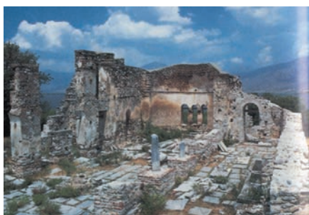
Αγ. Αχίλλειος, ερείπια της τρίκλιτης βασιλικής στις Πρέσπες, που ανήκαν στη Μητρόπολη Οχρίδας.