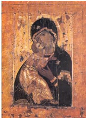
Παναγία του Βλαντιμίρ, 12ος αι. Μόσχα. Η εικόνα έδωσε την αγιογραφική κατεύθυνση στους Ρώσους εικονογράφους.

Η δημιουργία κατά τα μέσα του 11ου αιώνα μοναστικής ζωής στη Ρωσία είχε ως αφετηρία το Άγιο Όρος και τους μοναχούς Αντώνιο και Θεοδόσιο. Από αυτούς δημιουργήθηκε η μονή Κιέβου, που ανέδειξε επισκόπους, συγγραφείς, ζωγράφους και άσκησε μεγάλη επίδραση στον εκκλησιαστικό βίο της Ρωσίας. Η μεγάλη ακμή του ρωσικού μοναχισμού παρατηρήθηκε κατά τον 12ο αιώνα.