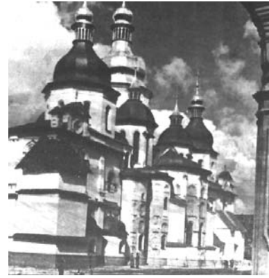
Ναός Αγίας Σοφίας Κιέβου.

Η δημιουργία κατά τα μέσα του 11ου αιώνα μοναστικής ζωής στη Ρωσία είχε ως αφετηρία το Άγιο Όρος και τους μοναχούς Αντώνιο και Θεοδόσιο. Από αυτούς δημιουργήθηκε η μονή Κιέβου, που ανέδειξε επισκόπους, συγγραφείς, ζωγράφους και άσκησε μεγάλη επίδραση στον εκκλησιαστικό βίο της Ρωσίας. Η μεγάλη ακμή του ρωσικού μοναχισμού παρατηρήθηκε κατά τον 12ο αιώνα.